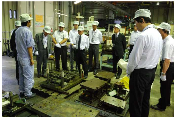
金型工程を見学する協会員

プレス工程においては、プレス機により鉄板が鉛細工のようにいとも簡単に成形されていました。メッキ工程においては、耐候性メッキに力を傾注しているとのことでした。実装柱荷重試験室においては取付バンドの破壊荷重試験を実際に行っていただき、その強度と破壊時の衝撃に見学者一同驚きを隠せませんでした。